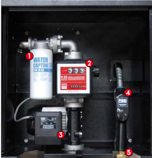
ST BOX Basic