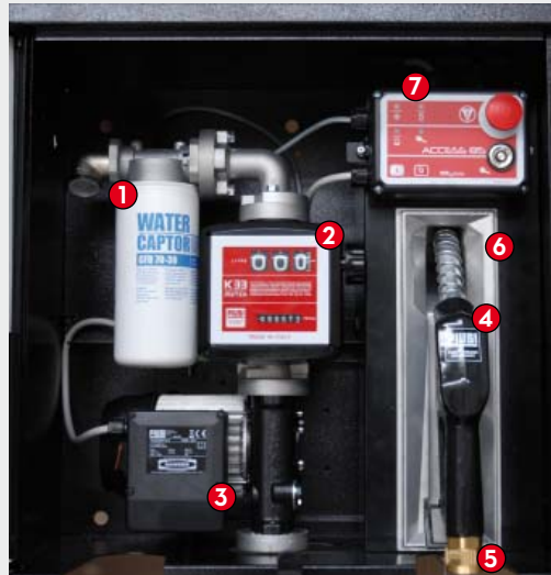
ST BOX Pro