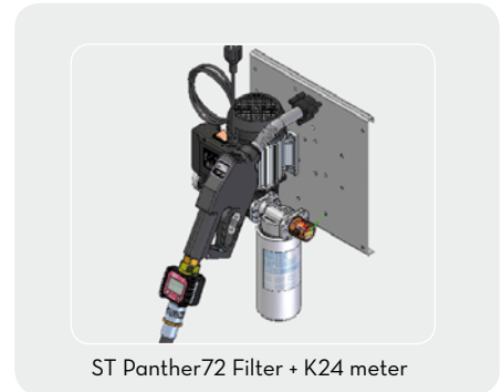
ST Panther72 Filter + K24 meter